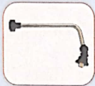
código 4751 Barra curva 120°