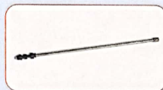
código 4748 Barra telescópica 0.66 a 1.24m