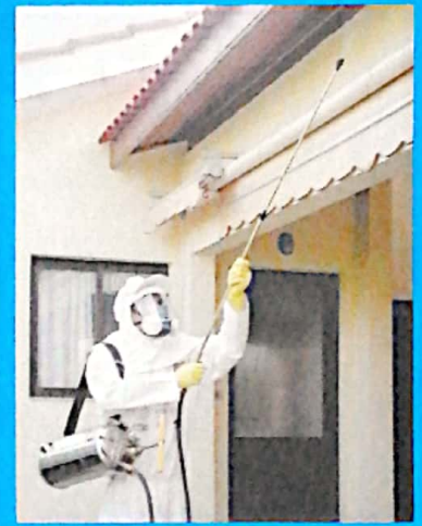
Aplicación con barra telescópica