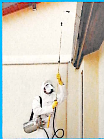
Aplicación con barra curva 120° y barra telescópica