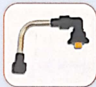
código 4750 Barra con boquilla rotativa 360°